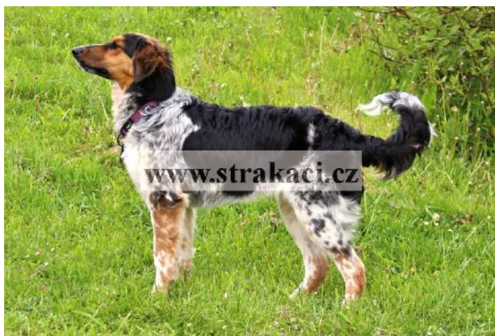
Abigail Dobrovodská hvězda