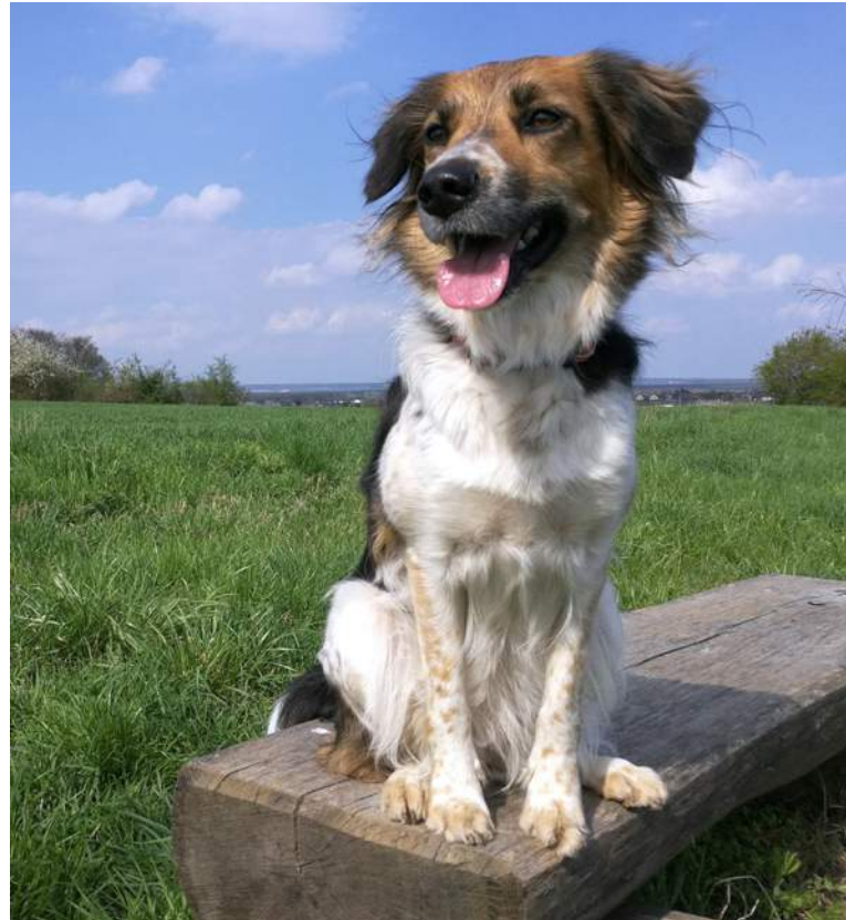
Ostražitá Cora