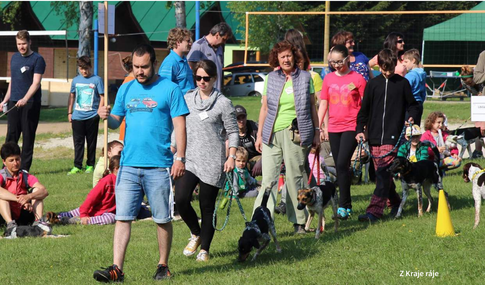
Z Kraje ráje

Jé dobrý den, my jsme od Fabíka. My máme Fifinku. Dobrý den, my Ferdinandovi říkáme Flek. Tak koukej, Fabí, ségra a brácha. Klid, Fabe, nežer bráchu!