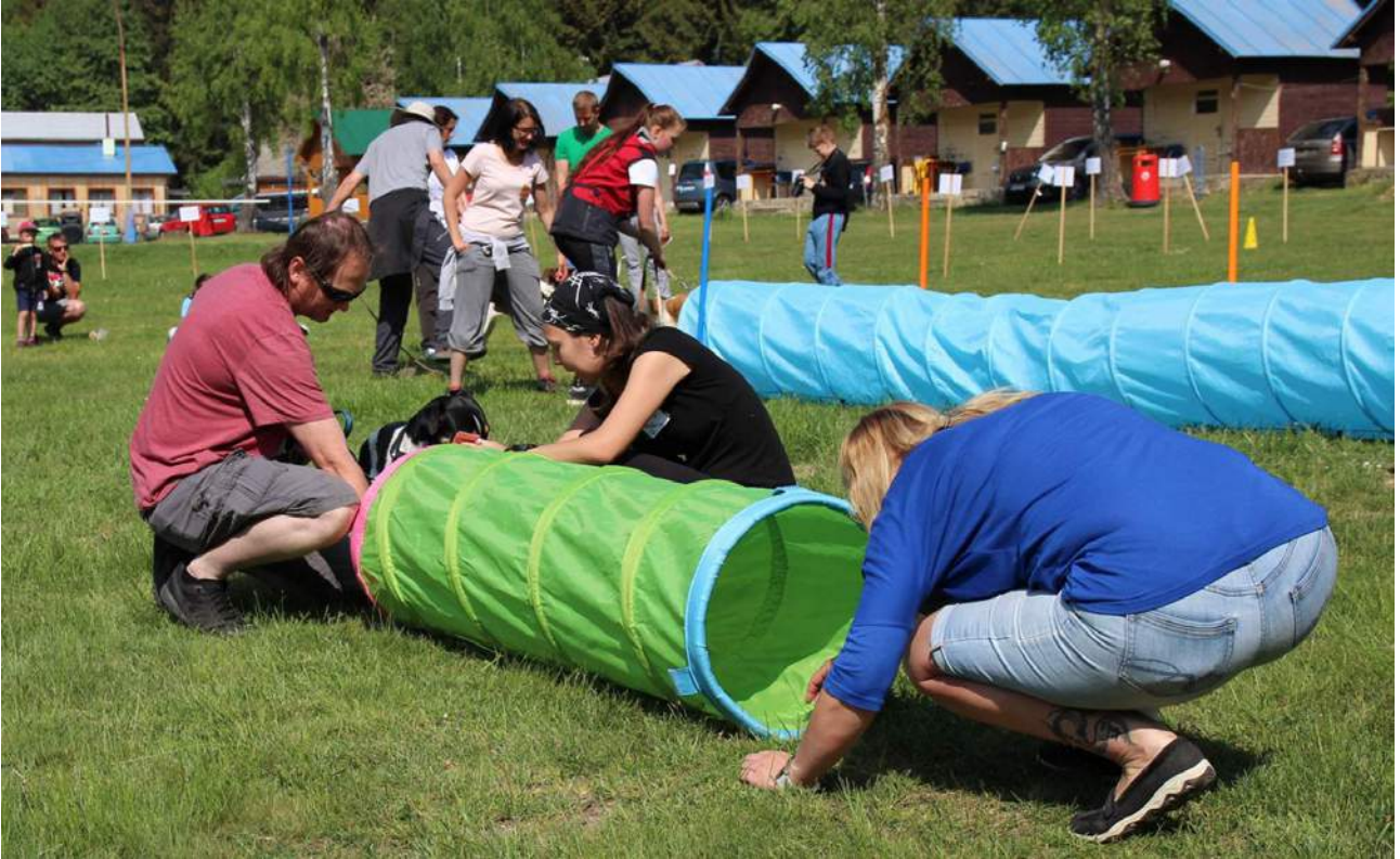
Seznámení s tunelem