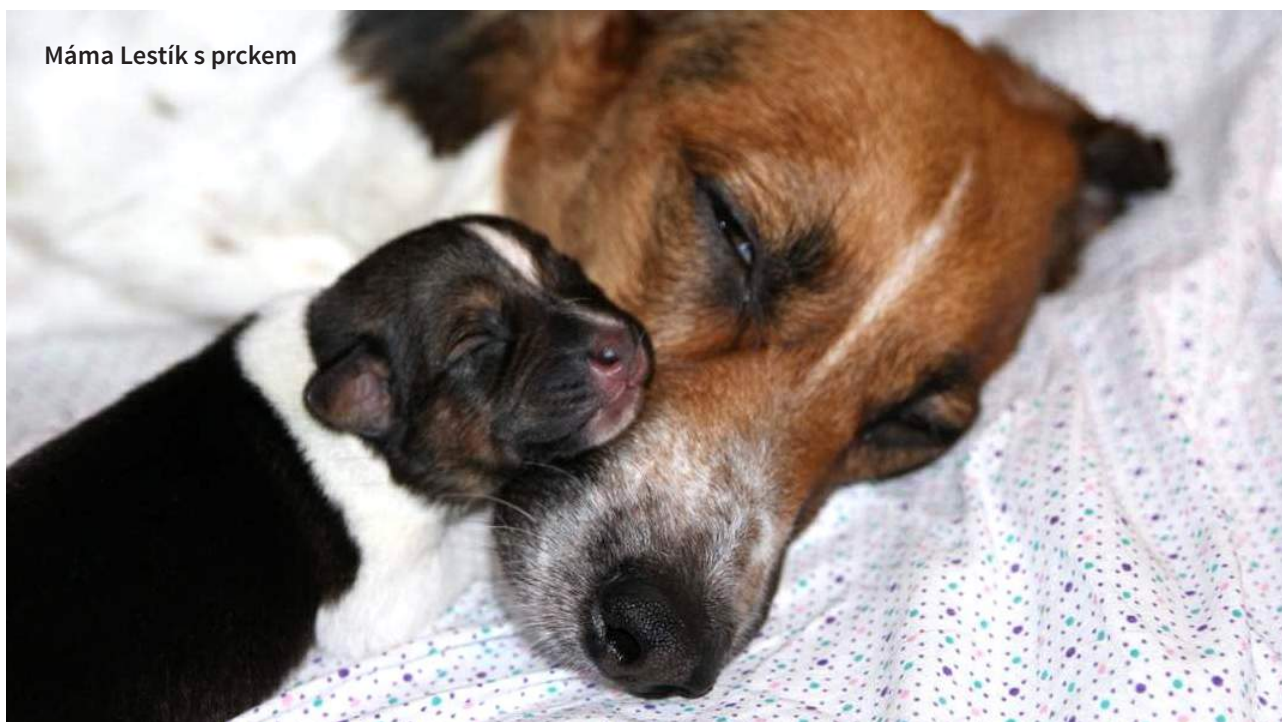
Máma Lestík s prckem