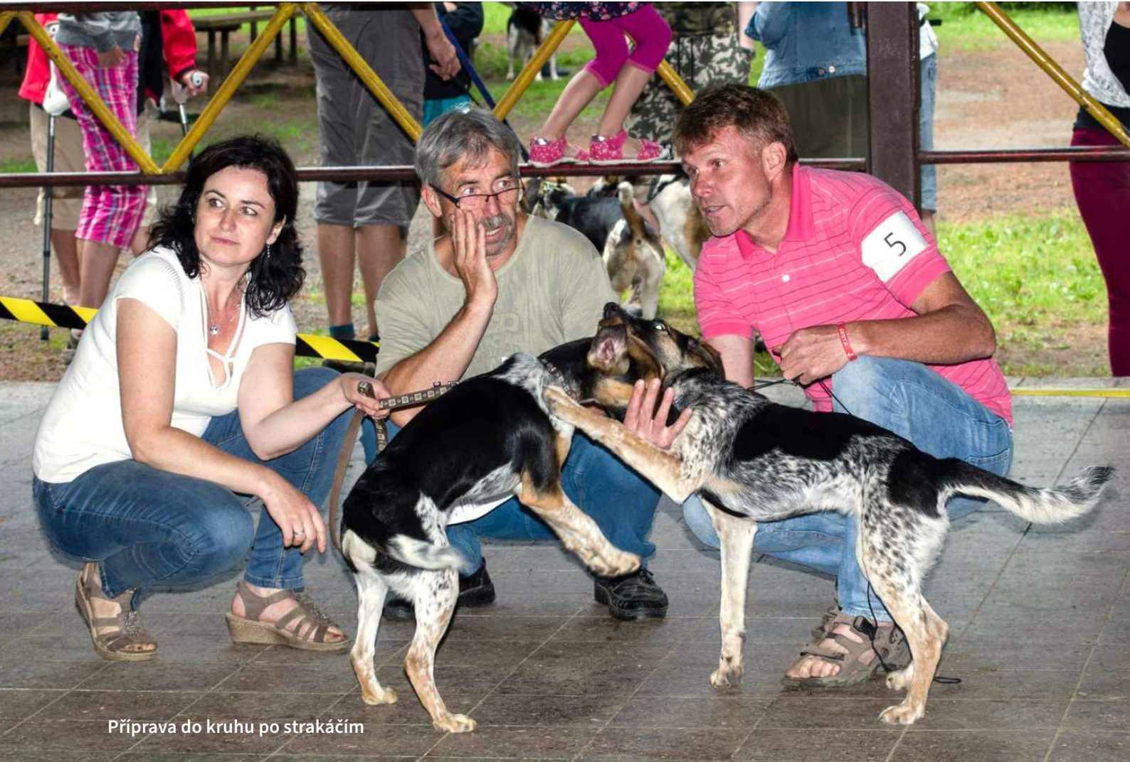
Příprava do kruhu po strakáčím

Vážení čtenáři zpravodaje a chovatelé „strakáčů“, ráda bych se s vámi podělila o svůj první reálný zážitek s vaší skvělou komunitou a svými pocity z něj. Tím zážitkem je výstava „NANEČISTO“, která se konala 2. 6. 2018 v Hlinsku.