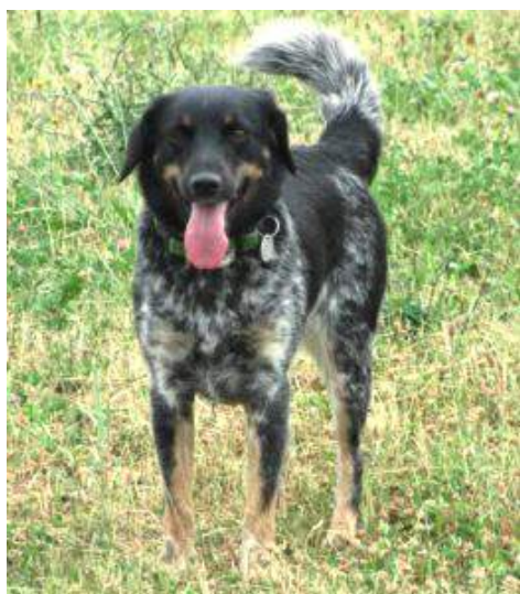
Balza Bonasa Sorbus