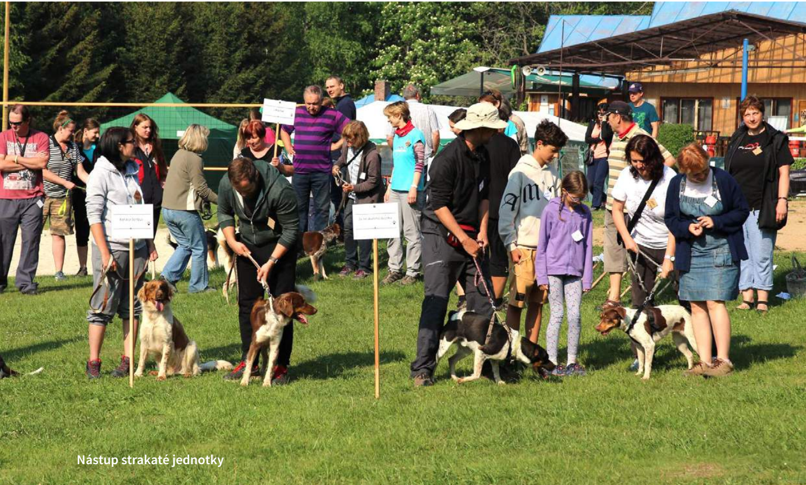
Nástup strakaté jednotky

DOBROU CHUŤ. DOBROU CHUŤ. Dobrou. Brou. Hm. Hmhm. Hm.