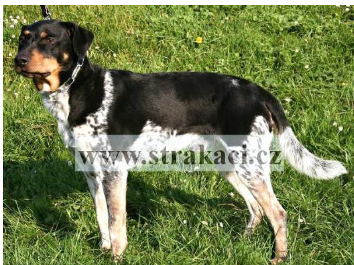
Baron z Luční ulice