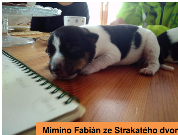
Mimino Fabián ze Strakatého dvorku.