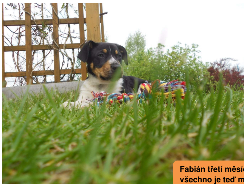
Fabián třetí měsíc: „Tohle všechno je teď moje!“