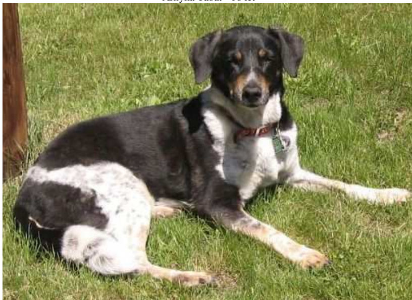
Arnyka Tabat - 16 let

V současné době jsou to nejstarší žijící strakáci, o kterých víme. Doufáme, že se ještě nějaký čas budou radovat ze života, a přejeme jim pevné zdraví.