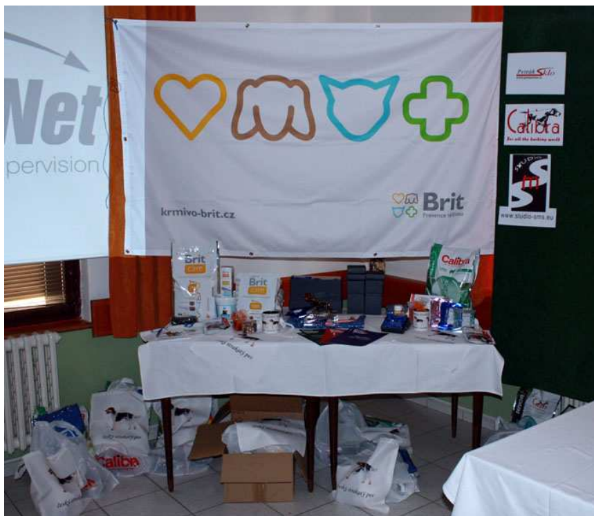
Foto z vyhlášení výsledků soutěže Pes roku 2010