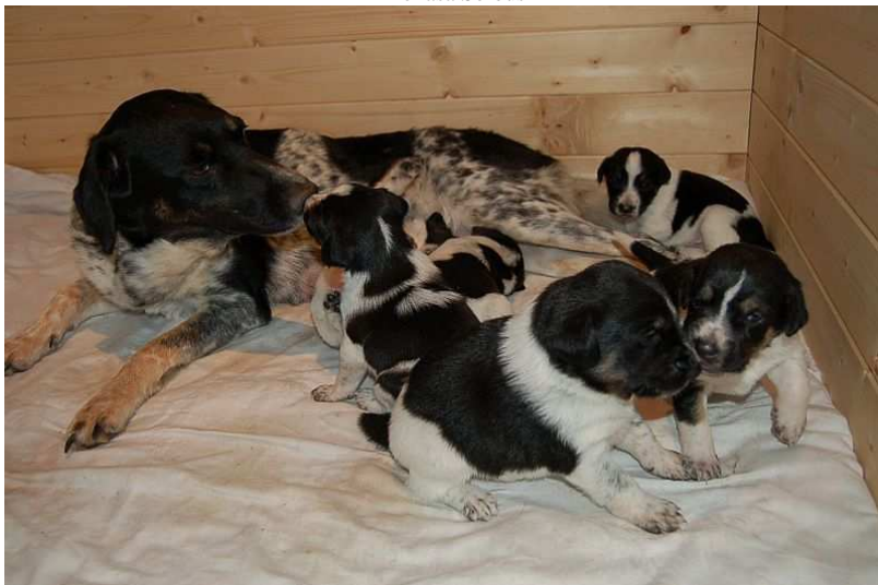
A Bonasa Sorbus